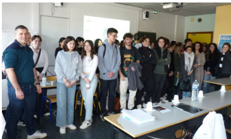
Rencontres au Lycée François Mansart à Thizy les Bourgs