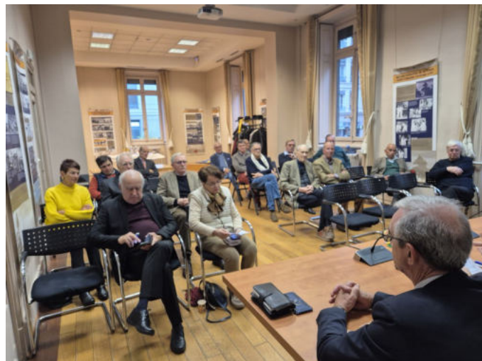
L'assemblée des sociétaires