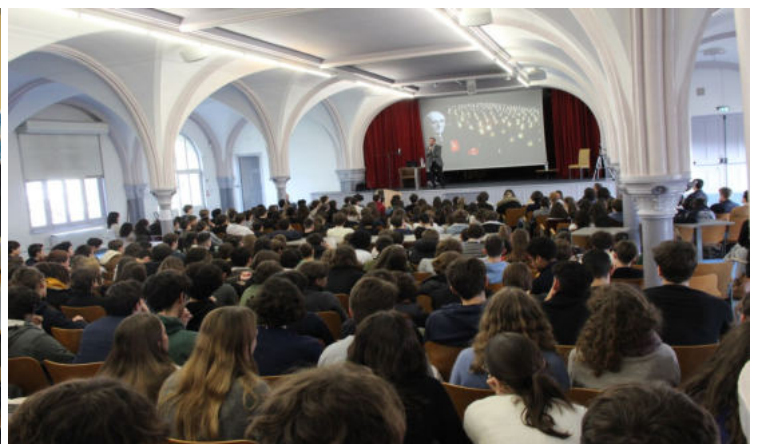
Rencontres Aux Lazaristes - La - Salle