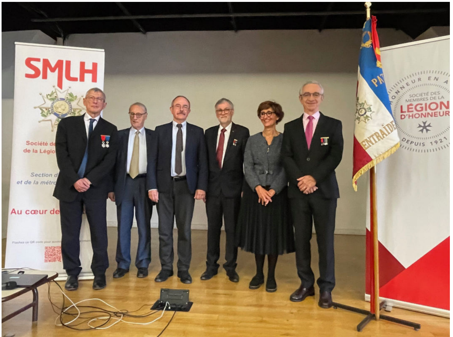
Le nouveau bureau de section

Election du nouveau bureau de la section SMLH du Rhône et de la métropole de Lyon