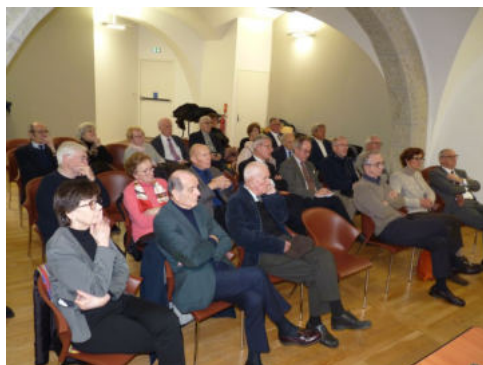
Une assemblée attentive