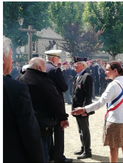
8 juin : cérémonie Indochine au Pagodon avec le président du comité Monument Indochine de Dinan, le Gal d'armée Le Pichon (nous avons remémoré la guerre du Golfe).