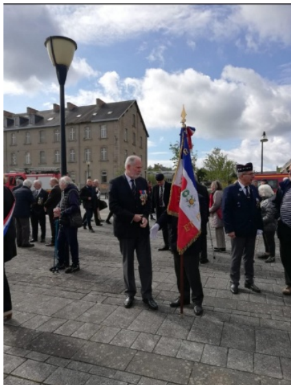
23 avril : cérémonie aux victimes de la déportation à Dinan,