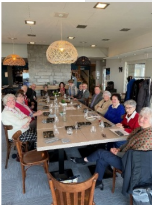
1 er février : galette des rois au golf de Saint-Cast. C'est toujours un grand plaisir de se retrouver pour commencer l'année en chantant l'hymne à la joie !