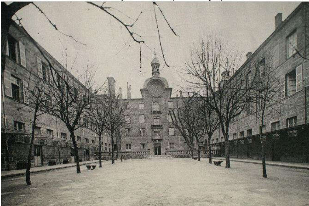
La cour du lycée Blaise-Pascal

La nationalisation des biens du clergé en 1789 et la mise en cause du statut religieux des enseignants en 1791 bouleversent le cadre du collège. En 1803 est lancé par le Consulat le projet d'un lycée installé dans les murs de l'ancien collège et accueillant les élèves des anciennes écoles centrales de la région organisées pendant la Révolution. Le lycée impérial ouvre en 1808. Les élèves portent l'uniforme de drap bleu-gris. Le lycée impérial est marqué par la rigueur de sa discipline toute militaire et par l'étroitesse de son enseignement tourné vers le passé.