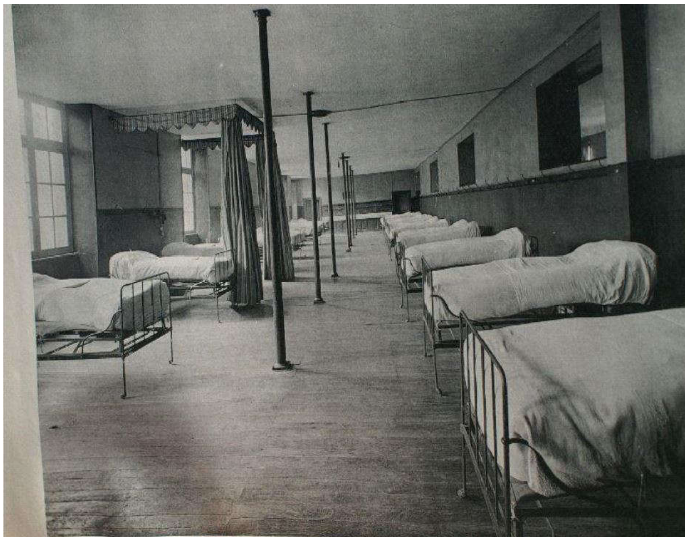
Les dortoirs en 1914 ( Archives du lycée )

A partir de 1930 la gratuité s'impose, mais il faut passer la barrière de l'examen d'entrée en sixième. Les effectifs dépassent les mille élèves dans les années 1930, dont près de 70% sont externes, signe du recul du modèle de l'internat. D'abord seul lycée du département, il recrute à l'échelle de l'Académie puis, progressivement, il devient le lycée avant tout de Clermont-Ferrand, sauf pour les classes préparatoires. Il joue un rôle central dans la formation des élites de la région, à l'instar du personnel politique.