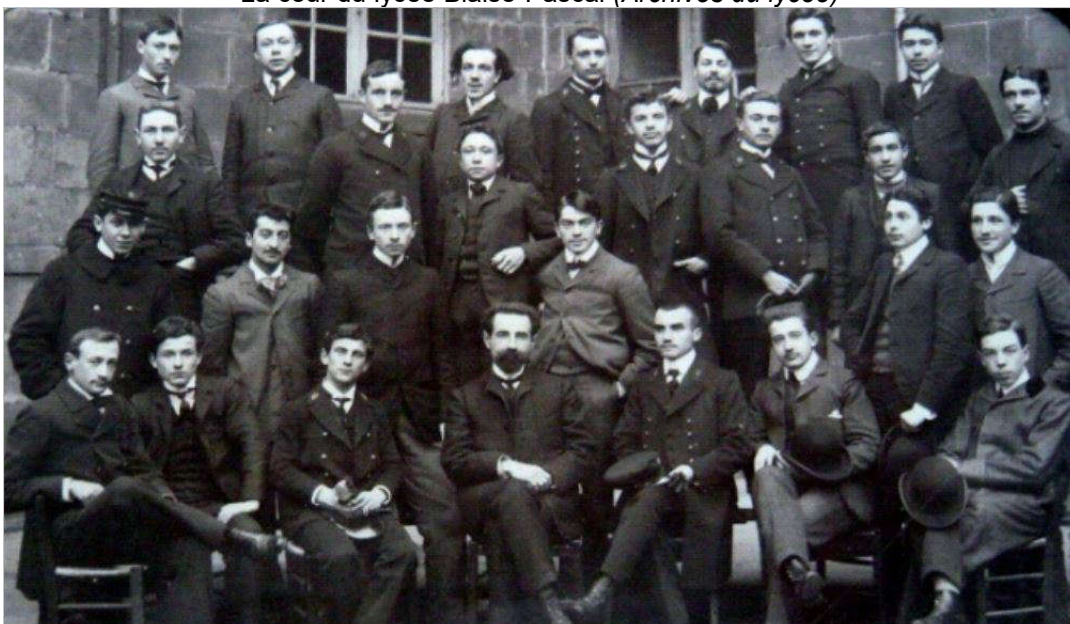
Les grands élèves. Photographie de classe 1904-1905