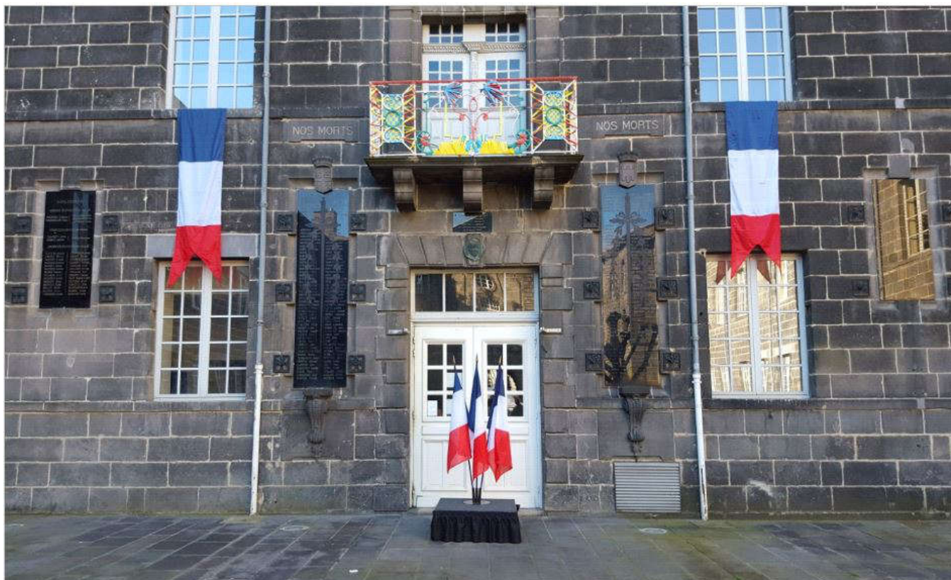
Les plaques commémoratives en hommage aux morts de la Grande Guerre ( Cour de l'ancien Lycée )

Durant le premier conflit mondial, grands élèves et professeurs en âge de combattre sont appelés sous les drapeaux. Certains devançant l'appel : 14 sont ainsi des engagés volontaires sur les 37 élèves mobilisés en 1915. Au total, 10% des élèves mobilisés périssent au cours du conflit. Les conditions de travail sont précaires. Classes surchargées du fait des regroupements, manque d'encadrement, la discipline en souffre. Comme ailleurs, une « scolarité de guerre » s'est organisée alliant mobilisation patriotique et effort de guerre. Les discours de fin d'année en sont les modèles : un patriotisme défensif et guerrier, une haine de l'ennemi et des appels à vaincre pour le triomphe du droit. Pendant tout le conflit, élèves et professeurs participent aux campagnes en faveur des emprunts de guerre, aux diverses journées patriotiques et œuvres de guerre. À l'issue du conflit, le 19 octobre 1922, le Lycée inaugure des plaques commémoratives comportant une liste des 190 anciens élèves et professeurs, morts pour la France.