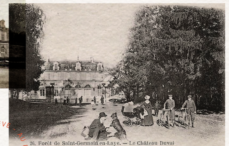
26. Forêt de Saint-Germain en-Laye. - Le Château Duvai

AU PLUS BEAU RÊVE - AU PLUS BEAU RÊVE - AU PLUS BEAU RÊVE