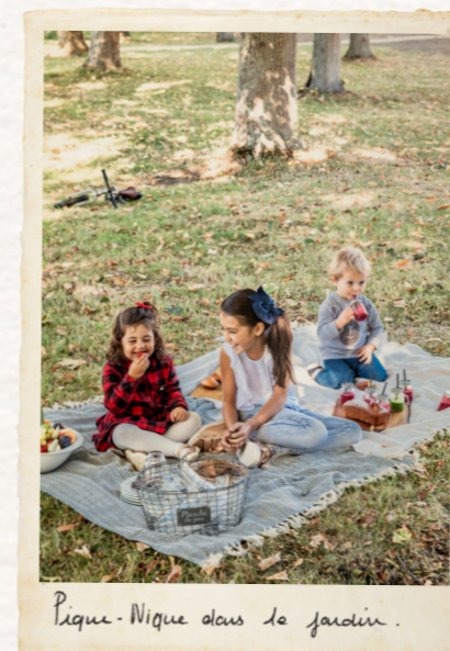
Pique-Nique dans le jardin.

Enfin, pour profiter pleinement d'une soirée ou d'une après-midi entre amoureux, un service de baby-sitting à la demande est disponible, en supplément, tout au long du séjour. La meilleure vie des enfants commence par celle des adultes !