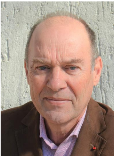
Humilité et Légion d'honneur.

Être reçu dans la Légion d'honneur est un événement qui marque et laisse rarement indifférent. Cela doit nous interroger sur la signification de l'appartenance à l'ordre, pour