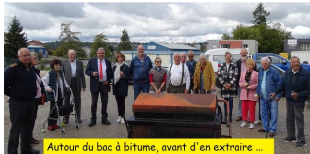
Autour du bac à bitume, avant d'en extraire ...