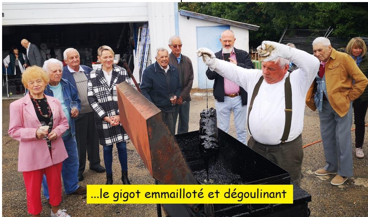
...le gigot emmailloté et dégoulinant