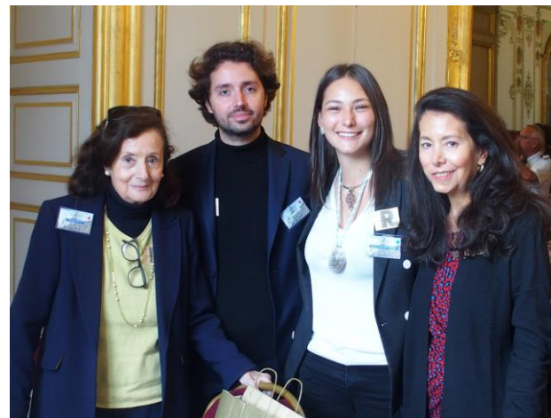
INGRID BETANCOURT ET SA FAMILLE